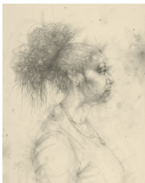
Porträt HS | Graphit | 2010