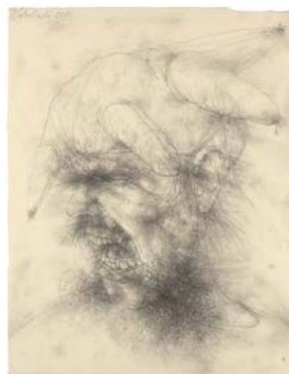
Harlekin (n.L.) | Graphit | 2012