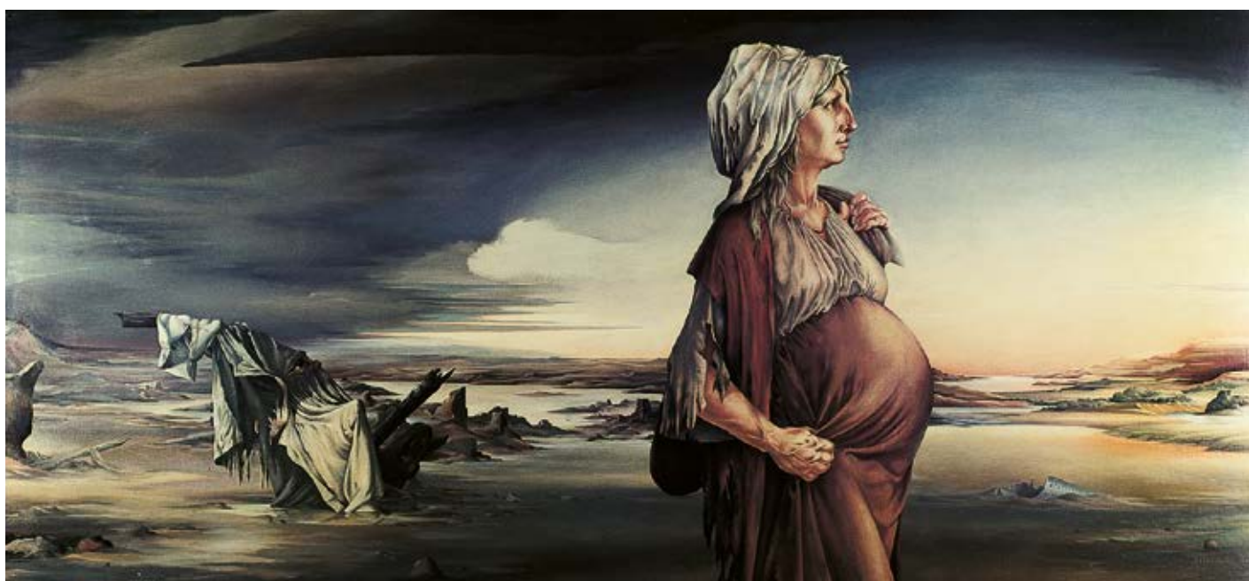
Deutschland 1525 - Die Auferstehung | Öl | 1974

Textausschnitt: Susanne Hebecker, Erfurt