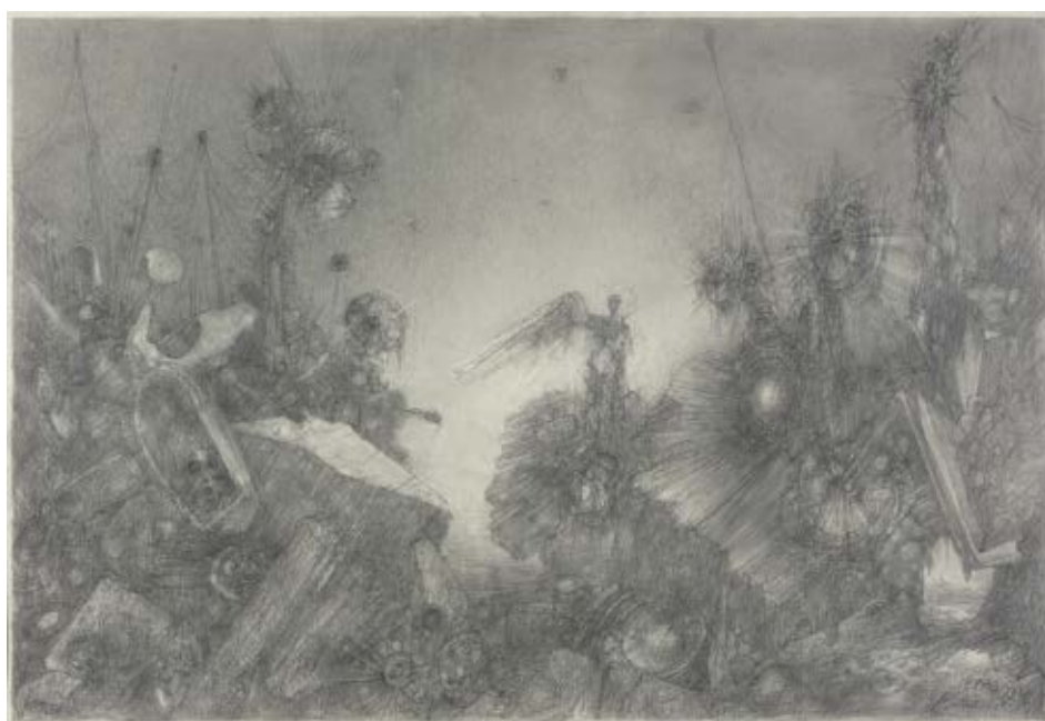
Welt B | Graphit | 1990/2013