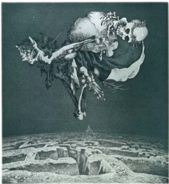
Ein Römischer Totentanz | Aquatinta | 1983