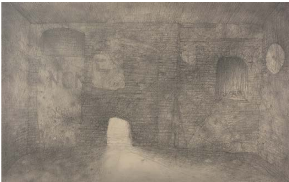
Durchblick | Graphit | 2012