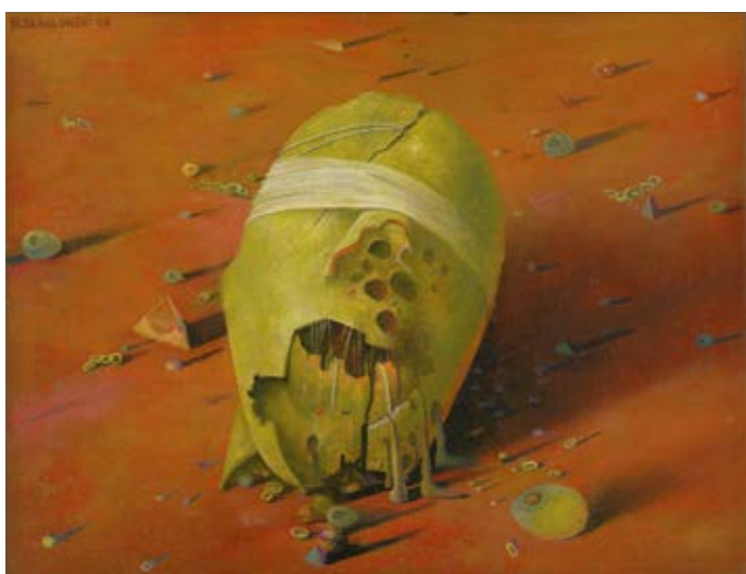
Das Gerücht | Öl | 2008